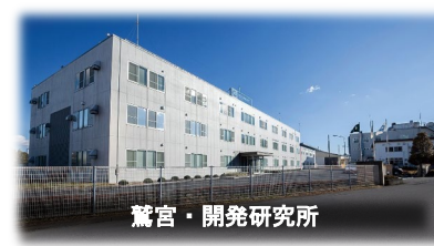
鷺宮・開発研究所