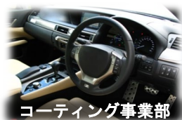
コーティング事業部

当社は創業以来、化学メーカーとして革新的な技術開発に挑み、長期にわたる実績と豊富なノウハウにより、お客様との強固な信頼関係を築いてまいりました。