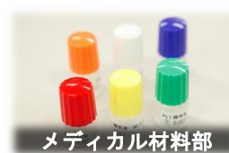
メディカル材料部